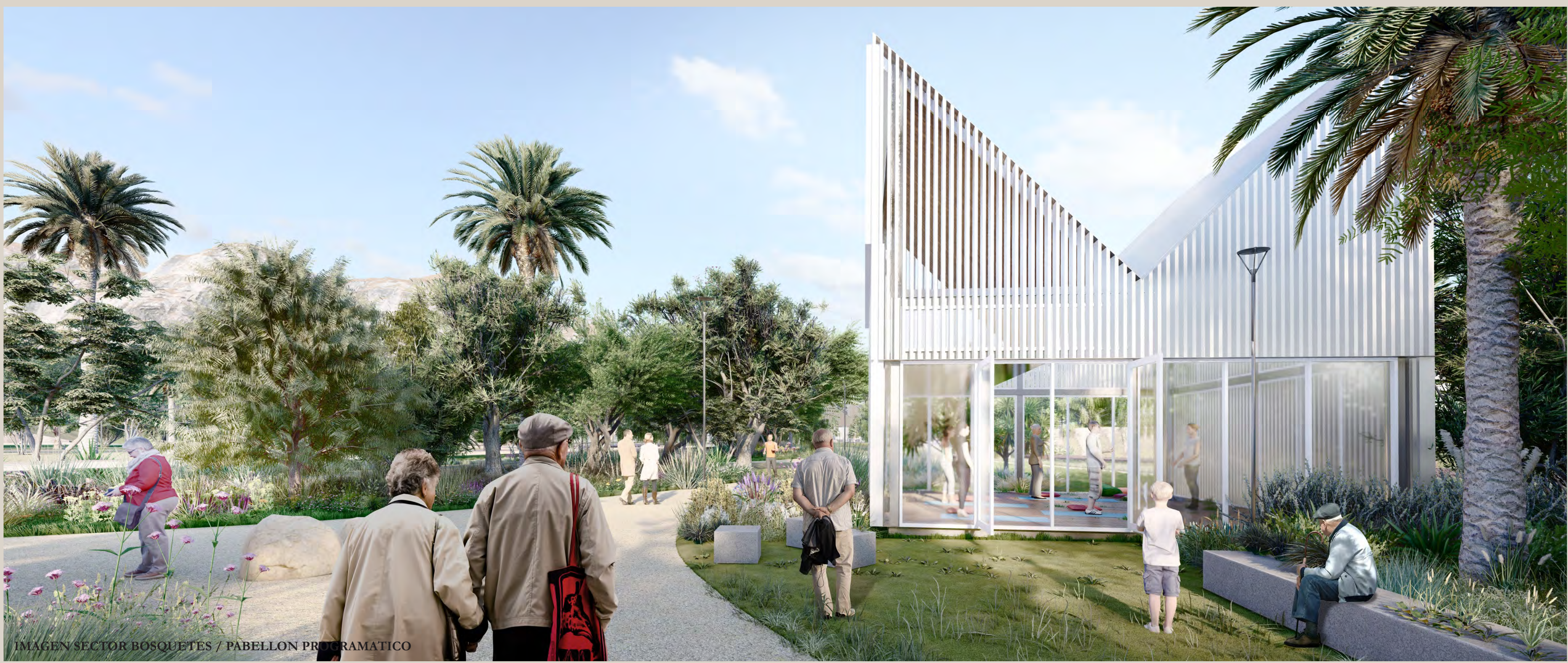
IMAGEN SECTOR BOSQUETES / PABELLON PROGRAMATICO